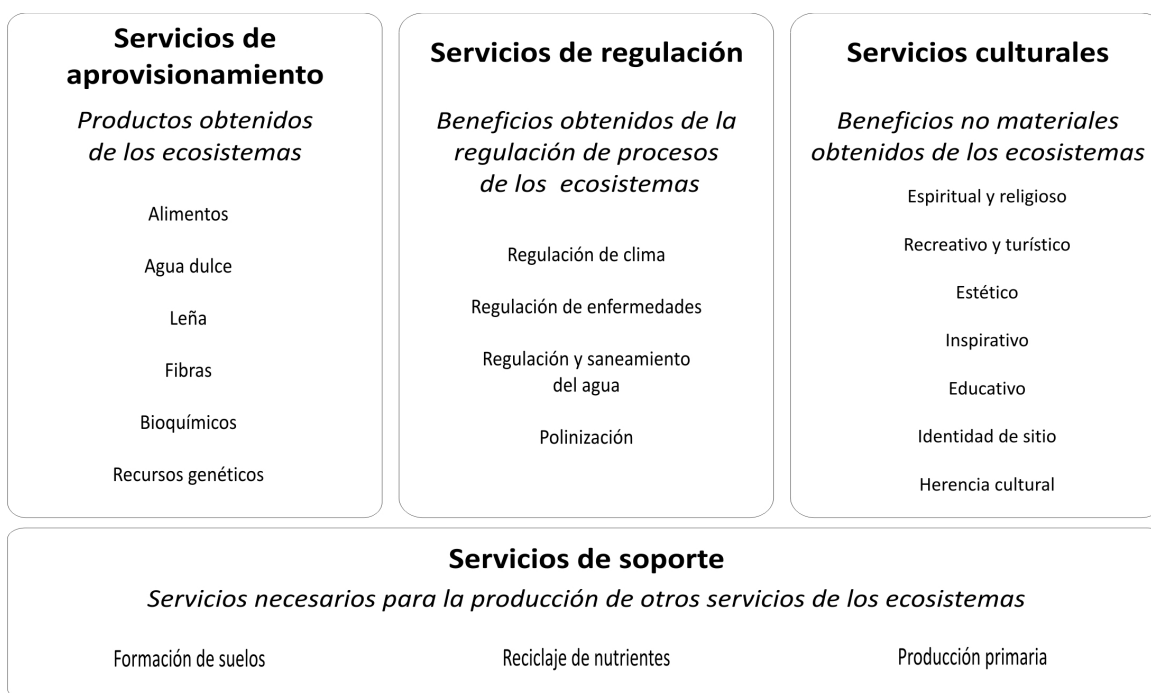
Figura 1 Clasificación de los servicios ecosistémicos (MA, 2005).

las consecuencias originadas por cambios en los ecosistemas y estuvo estructurado explícitamente alrededor del concepto de servicio ecosistémico como un intento de integrar completamente la sustentabilidad ecológica, la conservación y el bienestar humano. Ofrece un sistema de clasificación con propósitos puramente operacionales basado en cuatro líneas funcionales dentro del marco conceptual de MA que incluyen servicios de soporte, regulación, aprovisionamiento y culturales (Figura 1), con la intención de facilitar la toma de decisiones.